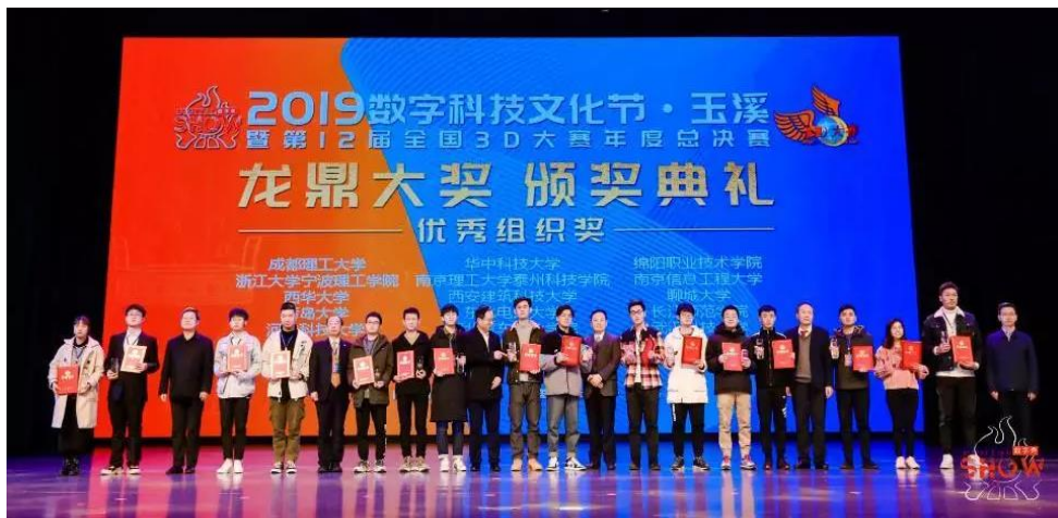
2019年聊城大学获得第12届全国3D大赛优秀组织奖