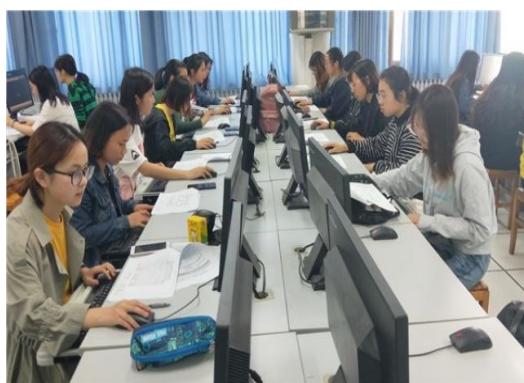
园林计算机辅助设计