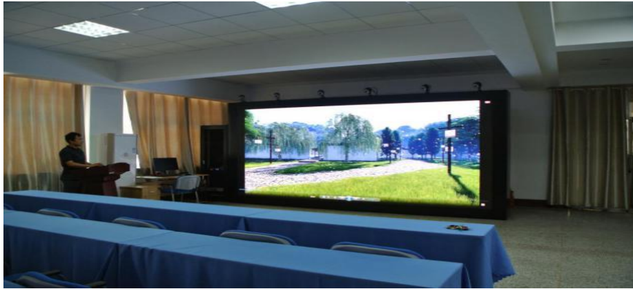
园林规划设计虚拟仿真漫