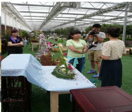
青岛插花比赛电台现场采访