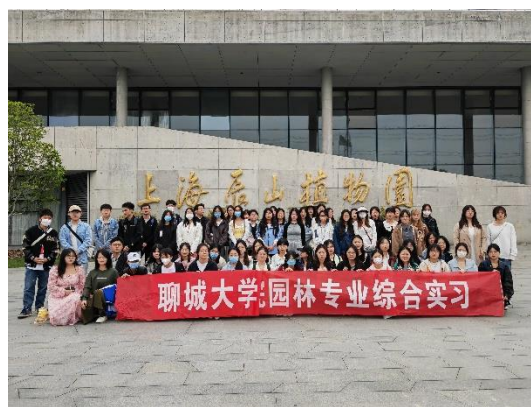
园林专业综合实习